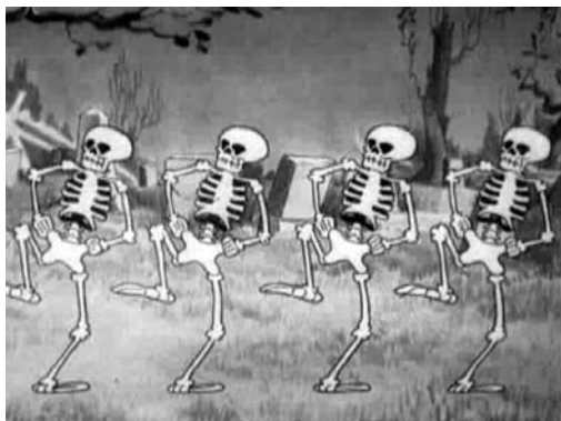
Un frame del filmato "The skeleton dance" (1929)