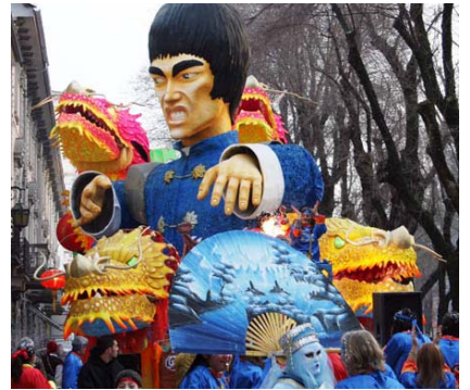
Carro 2007 di Rione Cervetto onlus

Da dove partire allora per cercare questi stimoli nuovi per mantenere viva una festa che i Vercellesi si sono dati , come le genti di mezzo Mondo?